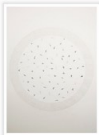
Nathalie Grimard, Nœuds 2 , 2012 perforation et fils sur papier