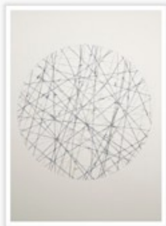
Nathalie Grimard, Nœuds 6 , 2012 perforation et fils sur papier

Un peu dans le même esprit, voici une exposition qui donne à voir la patience, le lent travail, la beauté à regarder de près. Hors du tapage de certains centre d'arts, la Galerie Trois Point a toujours eu une ligne curatoriale forte, et présente souvent en avant-première ce qui sera l'avant-garde de demain. Rien de moins. Dans cette belle exposition, j'ai été littéralement envoûté par l'œuvre de Nathalie Grimard. Le papier perforé, sur lequel est attaché des fils, des motifs simples, des cercles, des cibles, un point de fuite. De loin, on pourrait croire à un dessin. De près on comprend que l'artiste, telle une Ariane, tisse une œuvre qui émeut tel un haïku par sa nudité et sa rigueur. J'ai rarement été happé, captivé de telle façon pour une œuvre abstraite. Comment expliquer l'émotion née de la contemplation de cette série de Nœuds ? Je ne saurais dire. Il faut voir. L'image ne rend pas justice. Voir et acheter dirais-je. Et sans attendre avant que ce ne soit plus à la portée de tous.