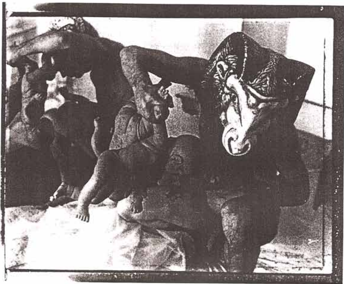
Evergon, Ramboy in Nursery with Mirror Image I , 1991. Photographie en noir et blanc; 138 x 164 cm.

Evergon, Galerie Trois Points/Jocelyne Aumont, Montréal. Du 6 septembre au 30 septembre 1995