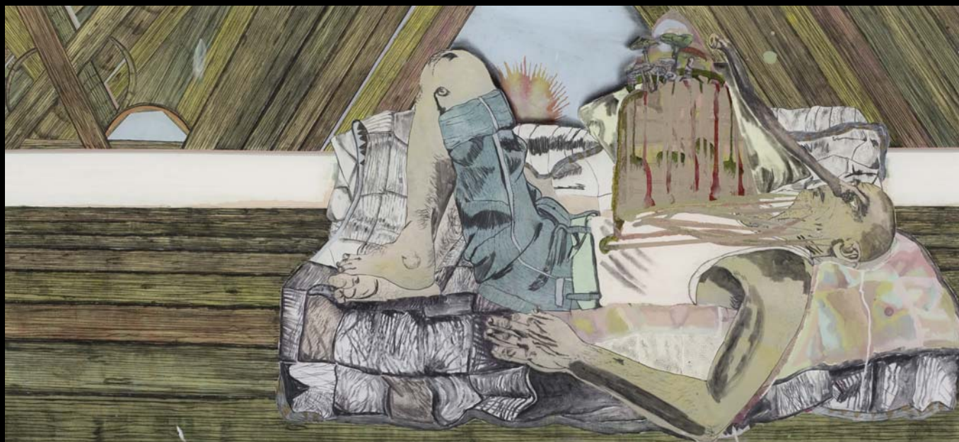
Max Wyse, Geophagic Man 2 , (61 x 122 cm), 2007.