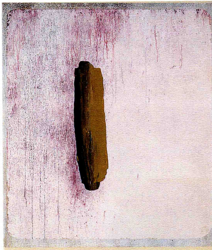
BEING 1996 ACRYLIQUE SUR TOILE 152 CM X 132 CM