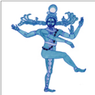
conseil | counsel