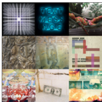
bulletin | newsletter