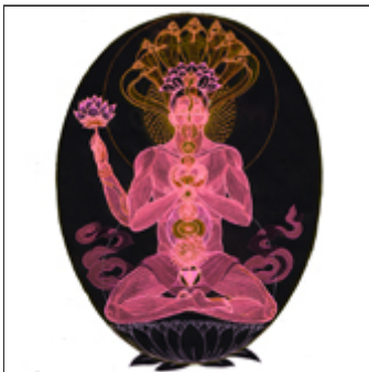
argumentaire | art plea

diverses qui nous étourdissent dans notre ère d'ultracommunication.