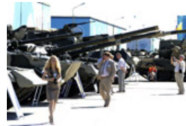
Cosecha de misiles y tanques