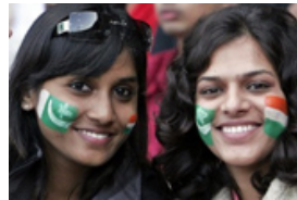
Claves de las relaciones entre India y Pakistán