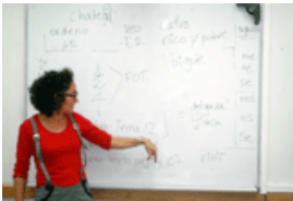
Lo que hay que saber para ser profesor de español en Rusia