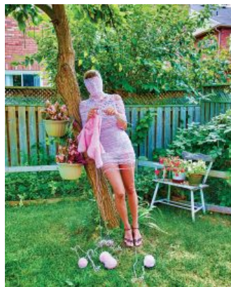
Photo: Maja Radanovic Ozegovic Maja Radanovic Ozegovic, Working on my Wings, 2012

17 janvier 2015 | Jérôme Delgado - Collaborateur | Arts visuels