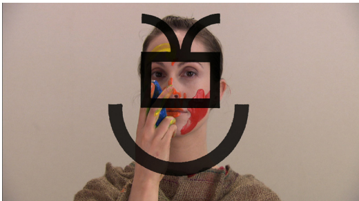
Mario Côté, Tableau 20 | 2009