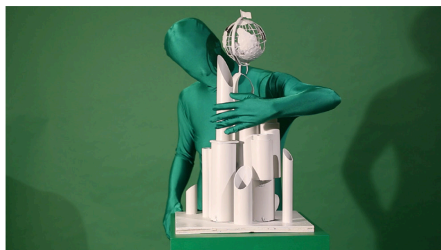
Milutin Gubash | Monument for Invisible People | 2018