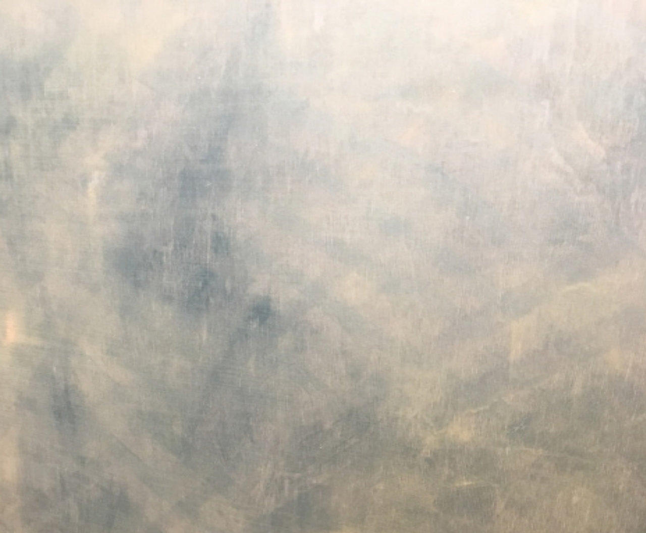
Dark Fence (détail)