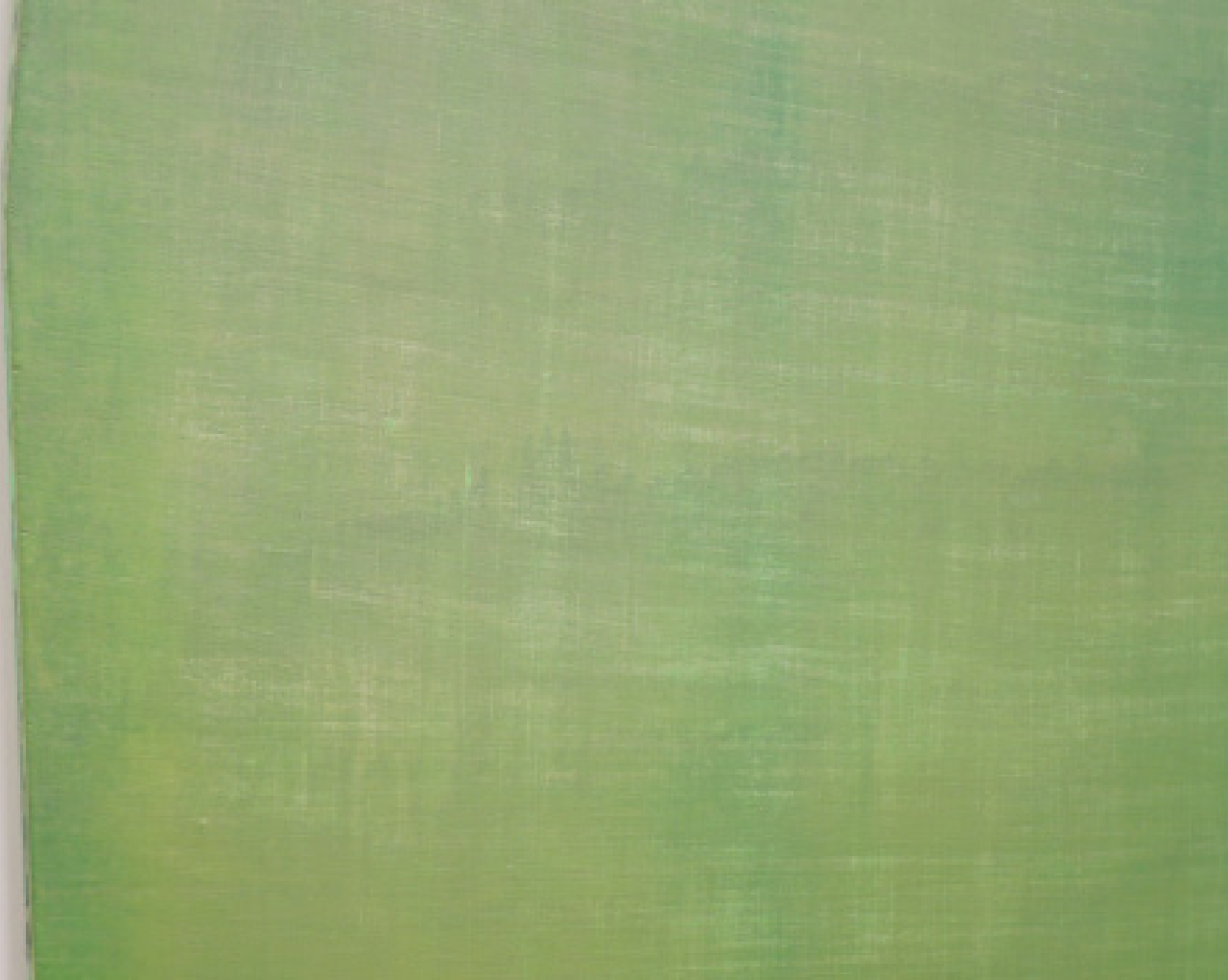
Long Walk (détail)