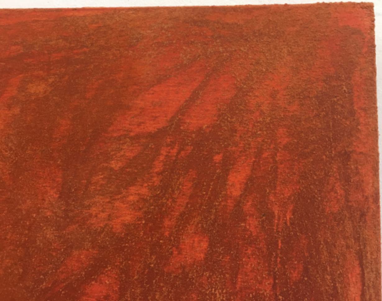
Long Walk (détail)