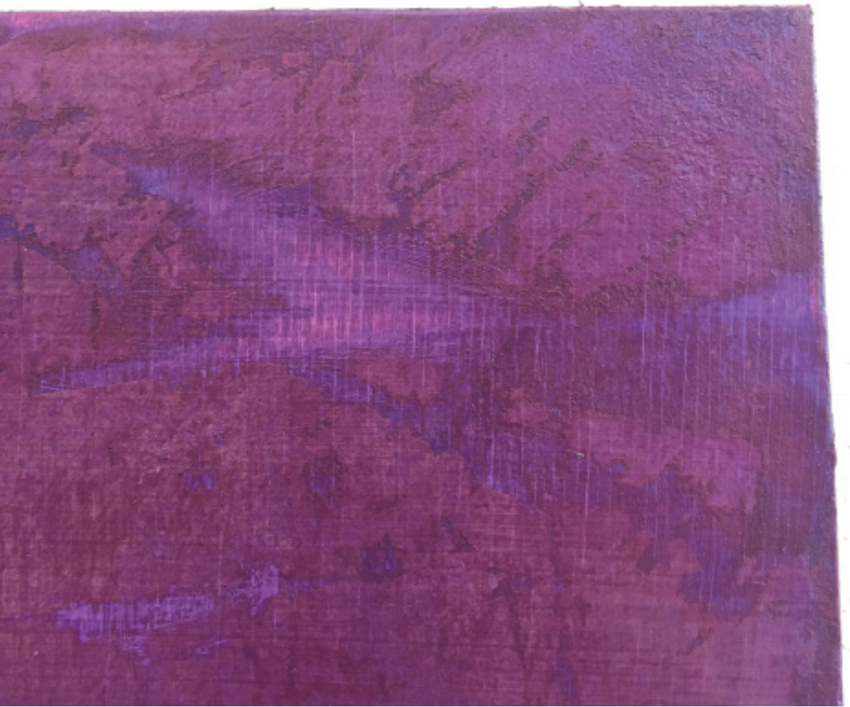
Gold Diggers (détail)