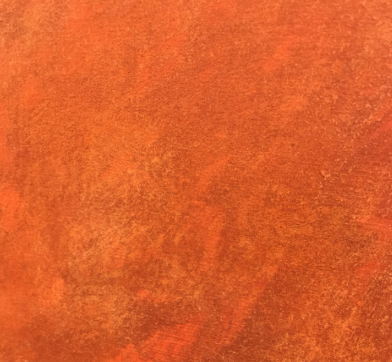
Long Walk (détail)