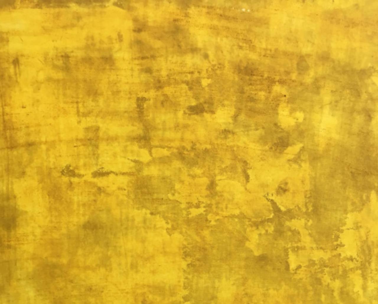
Gold Diggers (détail)