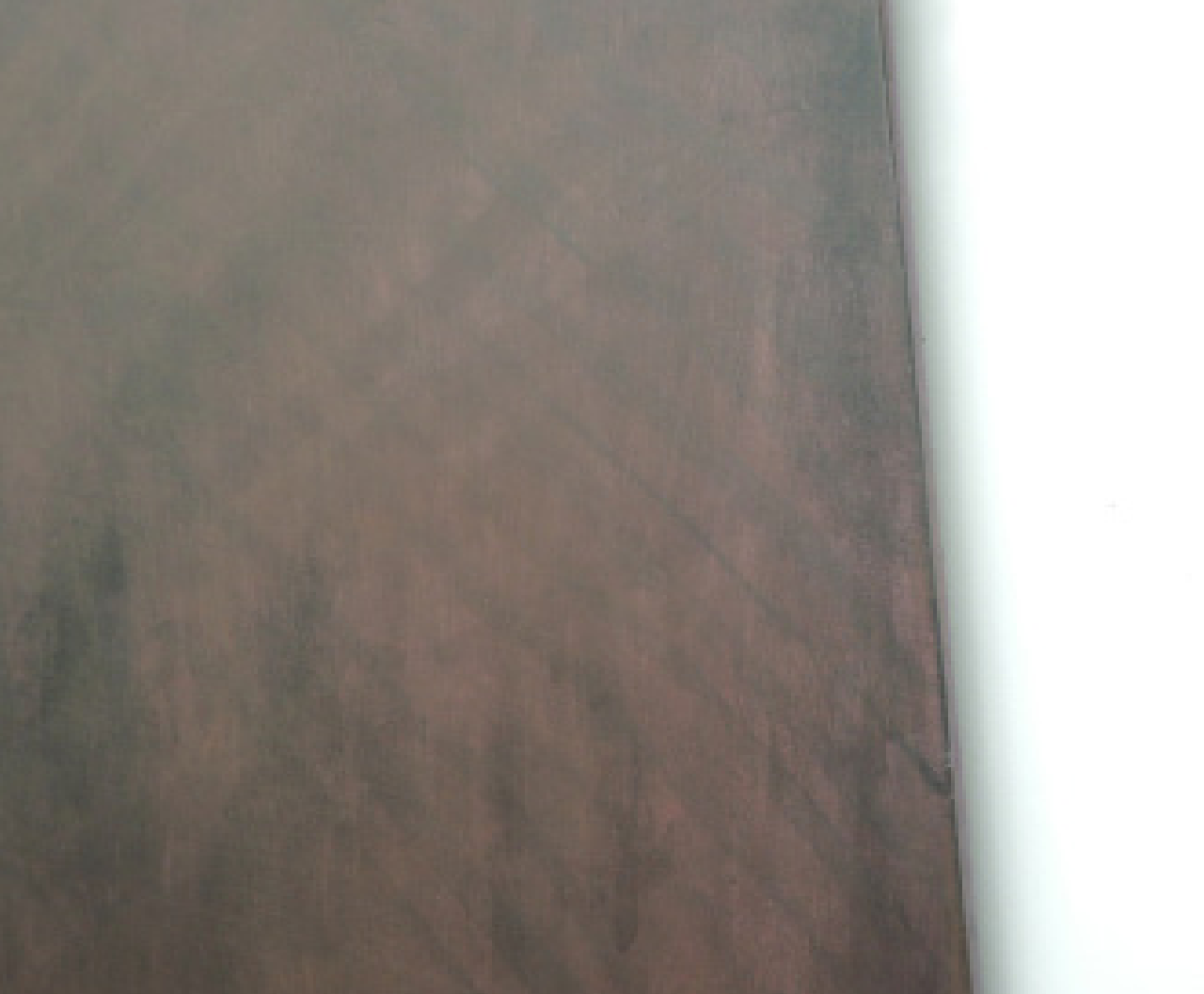
Dark Fence (détail)